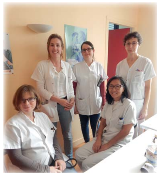
L'équipe du Cegidd.

Pendant les périodes de fermeture du CeGIDD, les prises en charge en urgence restent assurées au CH de Roanne via le service d'accueil des urgences, la confidentialité étant garantie dans tous les cas.