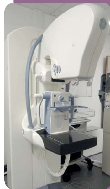
appareil de tomosynthèse