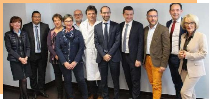
Les directeurs et présidents des CS, CA, CME.

Le Directeur Général du CHU de St-Etienne, le Directeur par intérim de la direction commune entre le CH de Roanne et les EHPAD de Coutouvre, Montagny et Pays de Belmont, les Présidents de Conseil de Surveillance du CHU de St-Etienne et du CH de Roanne, les Présidents de Conseil d'Administration des EHPAD de Montagny, Coutouvre, Pays de Belmont, se sont réunis jeudi 8 novembre 2018 pour la signature de la convention de direction commune.